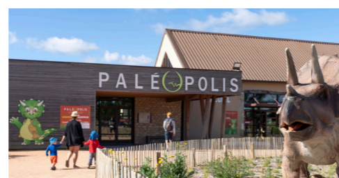
Sortie du 31-10 à Paléopolis