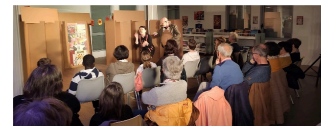
Spectacle « Scapin en carton »

Le vendredi 11 octobre, la compagnie Pantoum revisitait les « Fourberies de Scapin », une comédie de Molière. Un moment apprécié par les spectateurs. Retrouvez l'intégralité de l'agenda culturelle, en page de couverture.