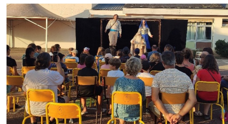
Spectacle RADJA le Rouge

Cette belle journée d'août 2024 s'est terminée avec le spectacle « Radja le Rouge » : près de 50 personnes ont vibré au rythme des combats d'épée et des chants de pirates prônant la liberté.