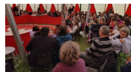
Journée intergénérationnelle - Cirque Luigi

La journée intergénérationnelle a eu lieu le vendredi 3 mai 2024 à la salle des fêtes de Mornay-sur-allier. Un événement organisé en étroite collaboration entre les services de la Communauté de Communes des 3 Provinces : l'Accueil de loisirs, le Relais Petite Enfance et la Médiathèque mais également avec des partenaires extérieurs (APLEAT-ACEP, Mairie de Mornay-sur-allier et l'EHPAD du Pré Ras d'Eau). Cette journée a permis de rassembler plusieurs générations autour d'un même événement.