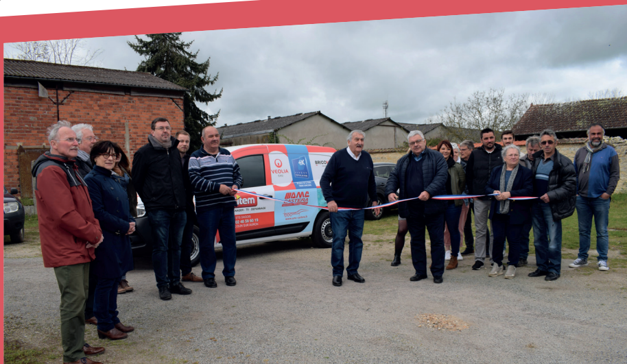
Présentation du véhicule le 12 avril en présence des entrepreneurs

En 2022, la Communauté de communes a fait le choix de confier à la société INFOCOM-FRANCE le financement en régie publicitaire d'un véhicule électrique en location, en réponse à un besoin suite au renfort de nos services techniques et dans une politique de gestion plus écologique du parc de la collectivité. Le véhicule a été livré en mars 2023.