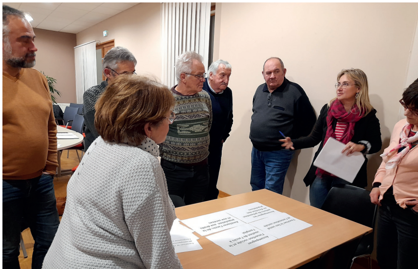
Réunion du comité technique en janvier 2023 : élus et techniciens ont travaillé ensemble sur la définition des enjeux de la CTG

Depuis septembre 2022, les élus ont engagé, aux côtés des partenaires, la préparation de la 5ème Convention territoriale Globale (CTG) de services aux familles, un dispositif désormais national mais dans lequel l'intercommunalité s'est inscrite depuis 2010, en tant que collectivité pilote.