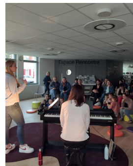
Concert jeunesse du 28 avril