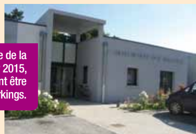
Deux ans après l'ouverture de la Maison de santé en janvier 2015, des travaux d'enrobé vont être réalisés sur les parkings.