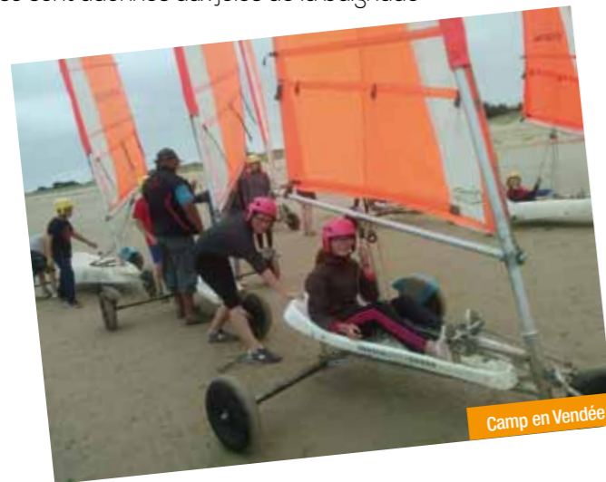
Camp en Vendée